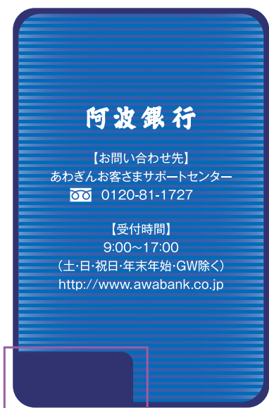
パスワードカード(裏面)