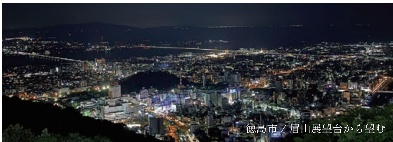
徳島市 / 眉山展望台から望む