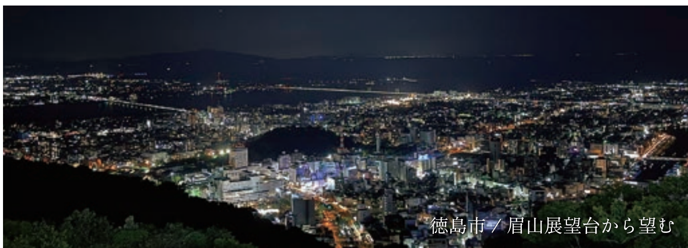
徳島市 / 眉山展望台から望む