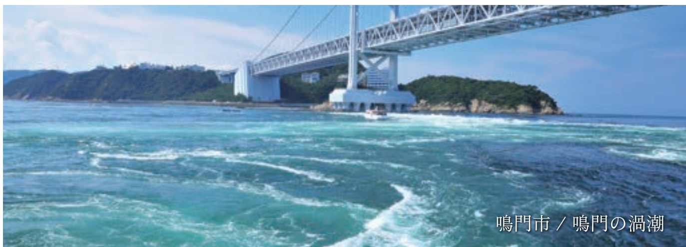
鳴門市 / 鳴門の渦潮