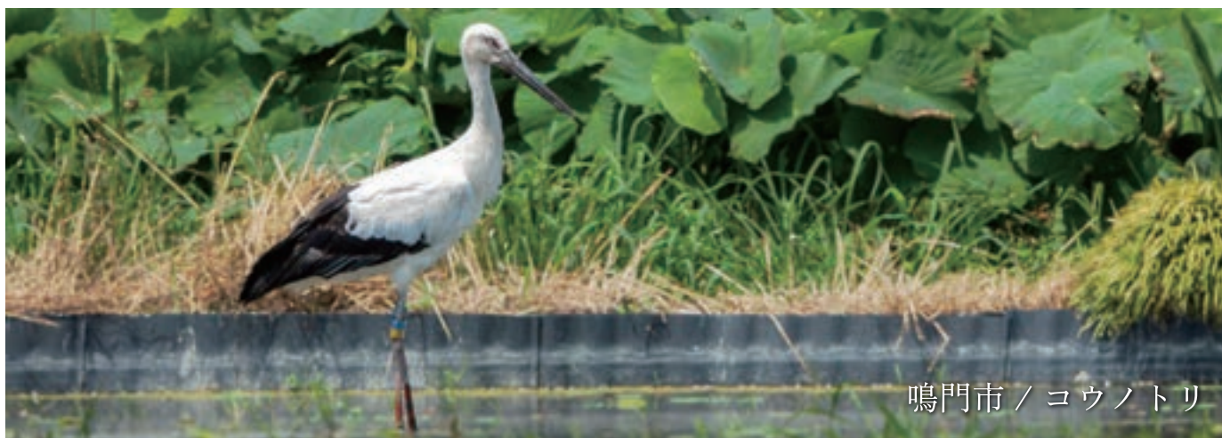
鳴門市 / コウノトリ