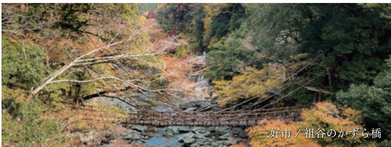
三好市 / 祖谷のかずら橋