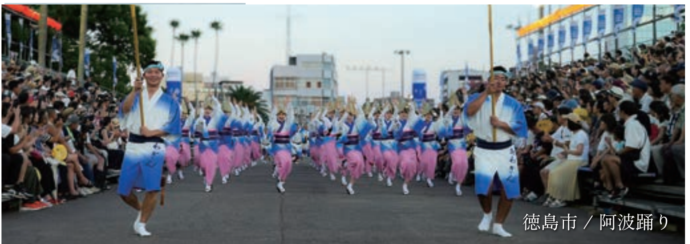
徳島市 / 阿波踊り