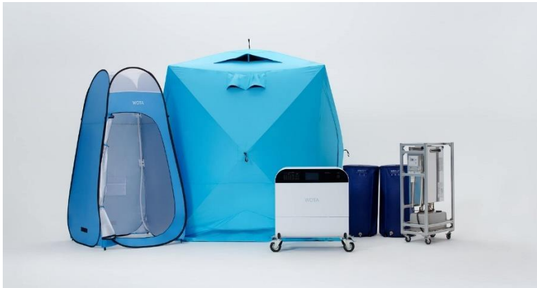
《水循環型シャワー「WOTA BOX」》

当行は、今後もお客さまと地域の持続可能性を高め、災害発生時のレジリエンス向上に取り組んでまいります。