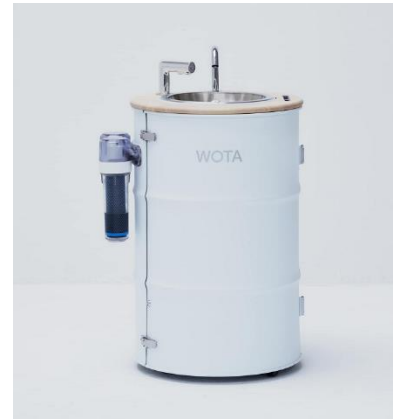
《水循環型手洗いスタンド「WOSH」》