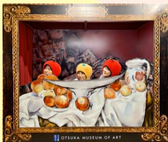
『リンゴとオレンジ』アートコスプレ

あわぎんBASEで 大塚国際美術館の 人気イベント・ アートコスプレが 体験できる！！