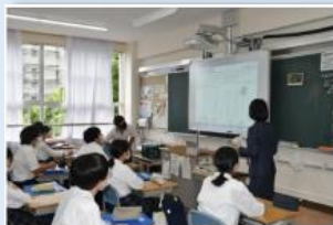
金融経済教育 出張授業

当行は、子どものうちからお金の大切さや仕組み・役割等の金融リテラシーを楽しく身につけ、将来、社会人として主体的に行動できるよう、小学校・中学校・高校などへの金融経済教育・出張授業を通じた支援を行っています。