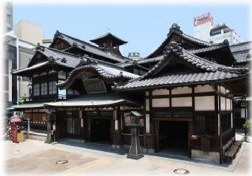
道後温泉

～ 高付加価値食品の創出に向けた、食品メーカーと素材メーカーのビジネスマッチング ～