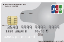
あわぎん pluscard JCB(一般)