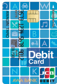
あわぎん JCB デビット