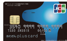
あわぎん pluscard JCB(ゴールド)